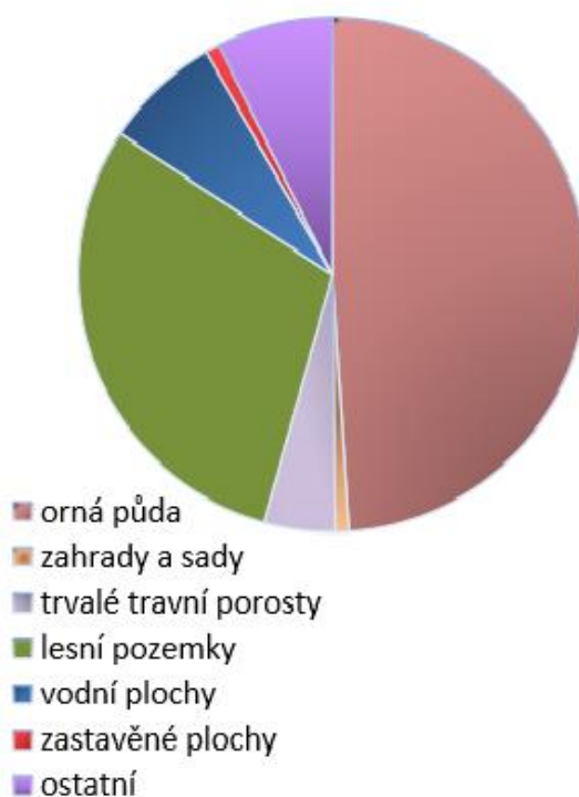
Graf land use správního území obce Lužnice

Koncepce uspořádání krajiny je stabilní. Plochy přírodní - lesní, vodní, trvalé travní porosty, atp. mnohonásobně převyšují urbanizované území. Zejména plochy orné půdy jsou dominantním prvkem ve správním území obce Lužnice.