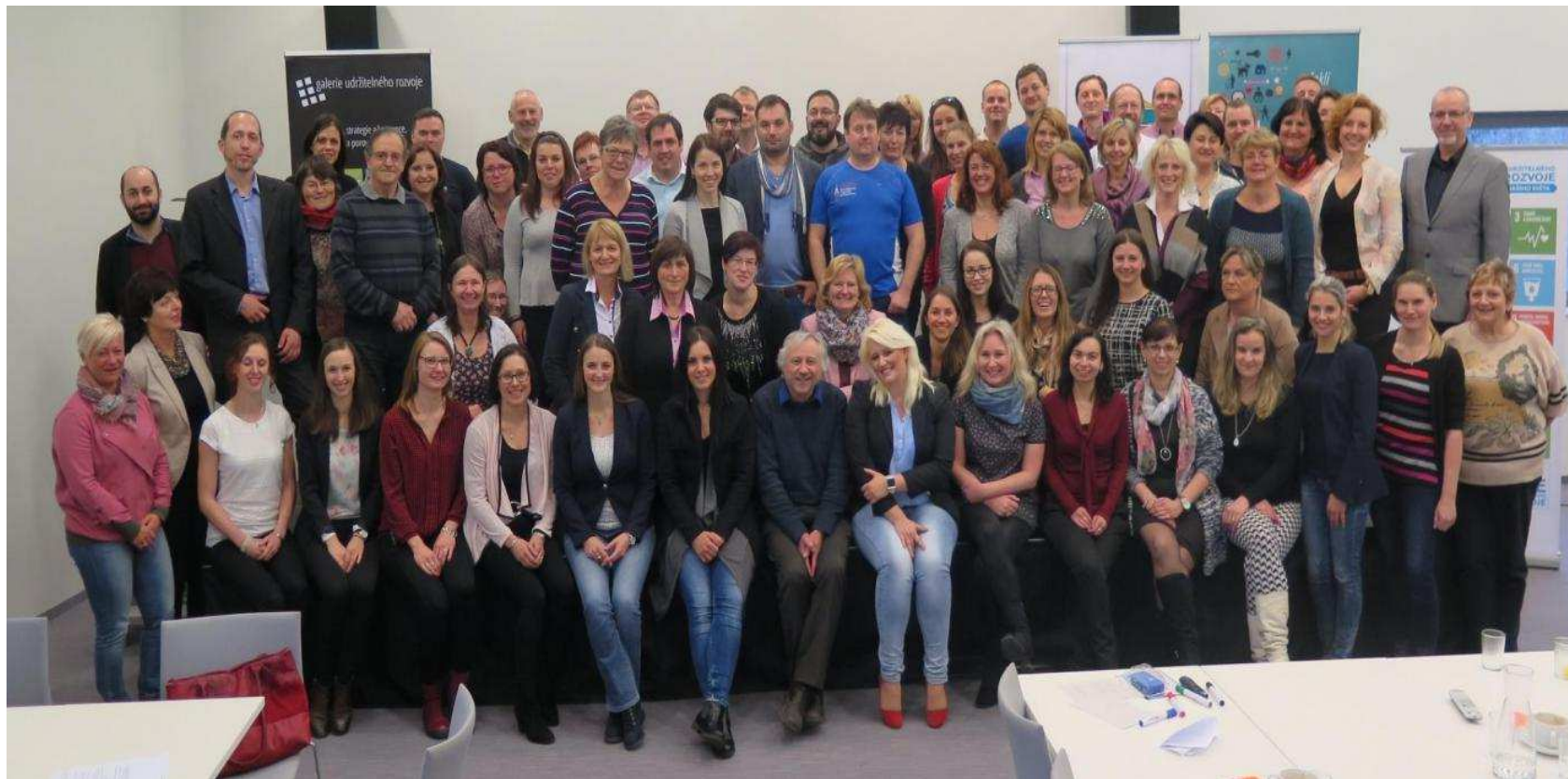
Závěrečné skupinové foto