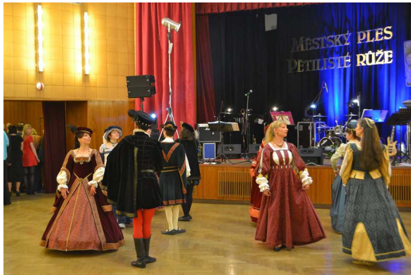
Pár fotek z plesu