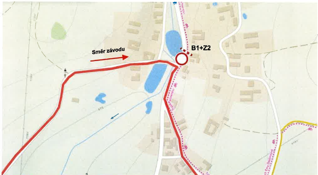
Situace č. 9 - Lásenice